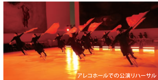
アレコホールでの公演リハーサル