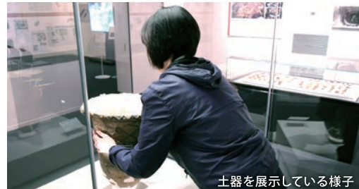
土器を展示している様子

三内丸山遺跡は、日本を代表する縄文時代の遺跡の一つです。毎年の発掘調査では新たな発見があるので、三内丸山遺跡に「行ったことがある」という県民の皆さまにも何度でもお