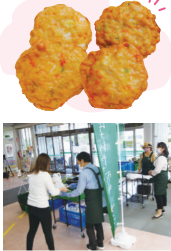
事前注文・配達販売(三沢市)

上北地域には産地直売(産直)施設が36施設あり、販売金額は県内トップクラスです。