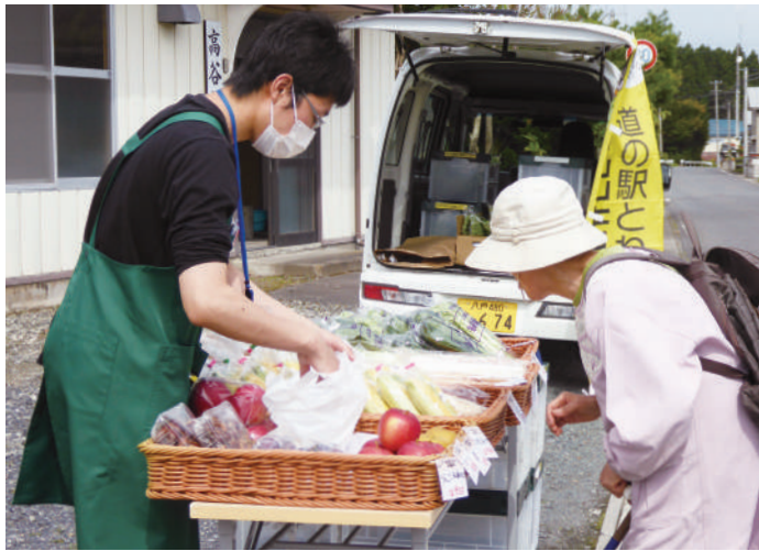
買い物が不便な地域への移動販売(十和田市)