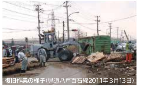
復旧作業の様子(県道八戸百石線2011年3月13日)

県では、「なかどまりまつり」において建設業を紹介するブースを8月11日に設置するほか、県の職員が皆さんの集会や学習会などにおじゃましてお話し、ご意見をお伺いする出前トークなどを実施し、建設業の果たしている役割について、皆さんにもっと知っていただくとともに、建設業のイメージアップと魅力発信の取組を進めていきます。