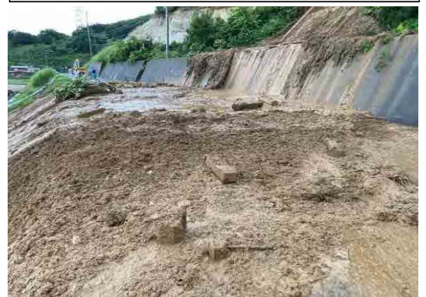
被災箇所② 今別町山崎