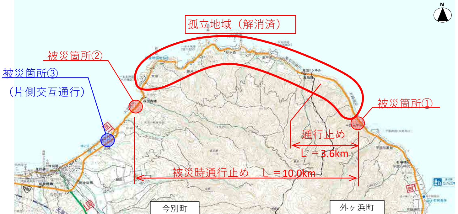
被災箇所① 外ヶ浜町平館元宇田