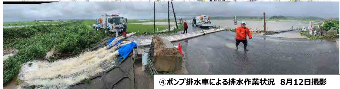
④ ポンプ排水車による排水作業状況 8月12日撮影