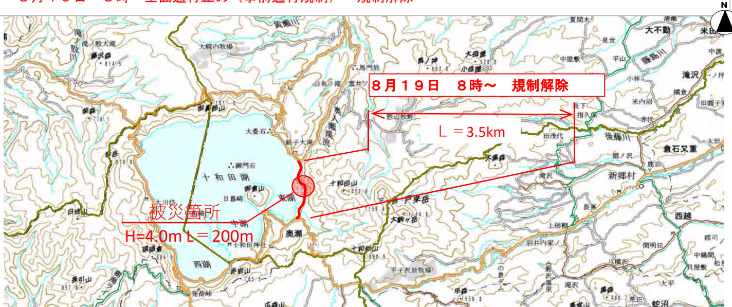
被災箇所 十和田市子ノ口