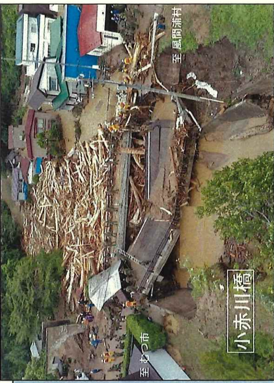
こあかがわばし 国道279号 小赤川橋 落橋状況