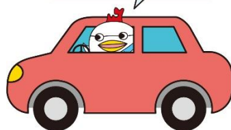
もったいない・あおり県民運動 キャラクター「エコ」

スマートムーブ通勤月間とは、10月1日～31日までの間、CO 2 排出量の削減に向け