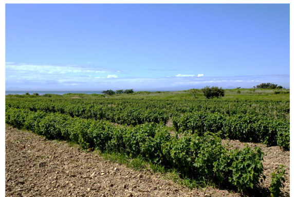
カシスの栽培状況