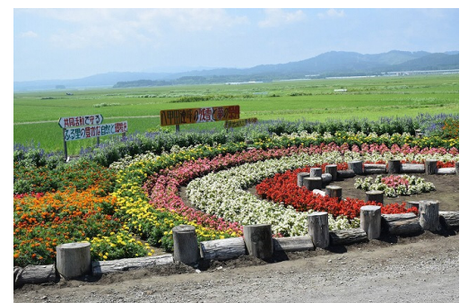
長科地域水土里保全隊の花壇（最優秀賞）

（青森県多面的機能支払推進協議会HP： http://www.aohozen.jp/ ）