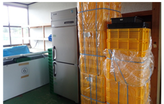
カシス冷凍設備（農業研修センター）