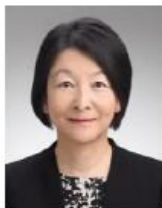
消費者庁 消費者教育推進課 課長補佐

昨年来の新型コロナウイルス感染症拡大を契機に言われなくなった「新しい日常」。その中でどのような消費行動が求められているのかを消費生活の取組とともにご紹介します。