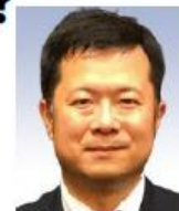
北里大学獣医学部 獣医伝染病学研究室 教授

感染症とは何か、わたしたちはどう感染症と向き合っていきたいのかを最新情報とともに学びましょう。