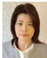
公益社団法人 日本広告審査機構 (JARO) 審査部

広告に関わる法律や、問題のある広告の具体的な事例を知り、広告を正しく読み取るポイントを学びます。