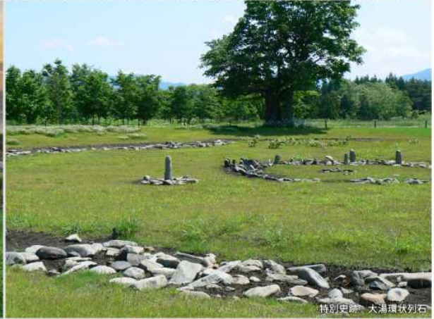
特別史跡 大海環状列石