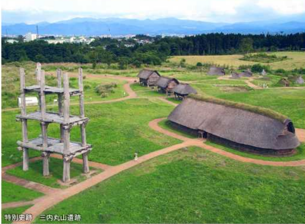
特別史跡 三内丸山遺跡