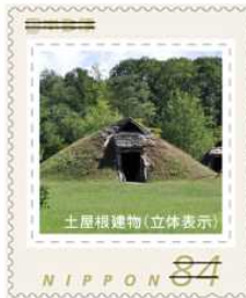
土屋根建物(立体表示)