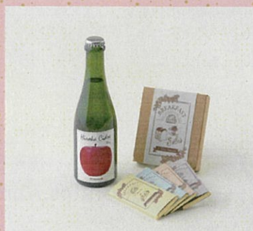
♡ ヒロカシードル Dry BREAK FASTシリーズ4種セット