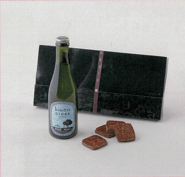
♡ kimoriシードル ドライ 津軽香々欧