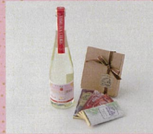
♡ タムラシードル Sweet 産地別自家焙煎チョコレート4枚セット