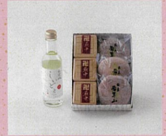
♡ 弘前城しいどる クリア 若草山、円最中