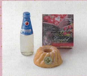
♡ ニッカシードル ドライ アップルクグロフ