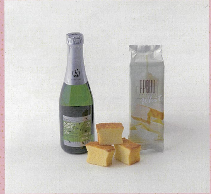
♡ アオモリシードル スパークリング ドライ ポロシヨコラ ホワイト