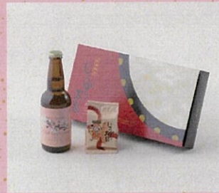
♡ ALE Craft hard cider (エール) じょっぱり太鼓