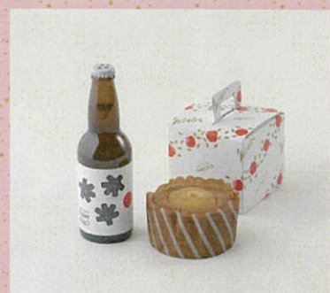
♡ テキカカシードル りんごわらべ