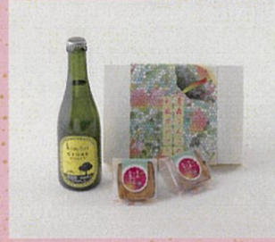
♡ kimoriシードル スイート 青森りんごの和風ガレット