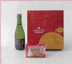
♡ アオモリmixシードル ボムsun