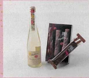
♡ ヒロカシードル 黄明&幸寿 ポロシヨコラ ラズベリー