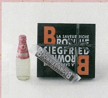
♡ ニッカシードル スイート ブラウニー

シードルとスイーツを組合せ、バレンタインデーやホワイトデーのギフトにいかがでしょうか? ここ数年、おいしさと個性を兼ね備えたシードルが、ご当地・青森県でも続々と誕生し、その多様性から、甘いものには甘いもの、酸味には酸味、リンゴにはリンゴといった調和的なペアリングも楽しいですが、チョコレートやナッツなどの香りとコク、渋みや苦みを引き立て寄り添うペアリングも大人向き。そもそもシードルはアルコール度数が低くて飲みやすく、375mlといった小瓶も揃い、おしゃれでカジュアルなプレゼントとしておすすめです!