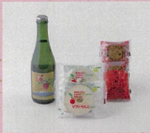
♡ 弘前市りんご公園オリジナルシードル たわわ、ソフトりんご