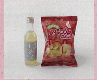
♡ 弘前城しいどる 無ろ過スイート 青森県産アップルスナック