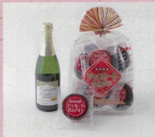
♡ アオモリシードル 弘前吉野町7ミディアム チョコレートせんべい