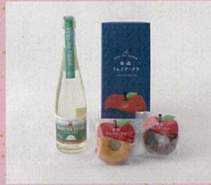
♡ タムラシードル Dry 青森りんごドーナツ(プレーン+チョコ)