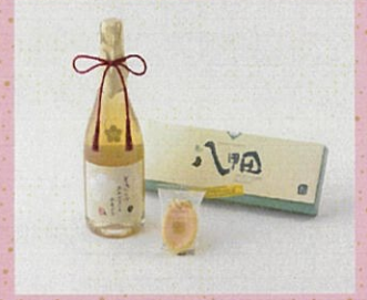
♡ ときシードル 朝の八甲田