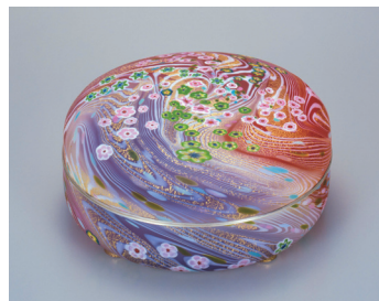
《ガラス管—花筏》 1996年 11.0 × 23.0cm 青森県立美術館寄託 撮影：大堀一彦

千葉県に生まれた石井は、制作の場を求めて訪れた青森で、四季のうつろいと共に自然がみせる豊かな色彩と鮮やかな変化に魅了され、1991年には、青森市郊外の三内丸山に念願のアトリエ「石井ガラススタジオ青森工房」を開設。1996年に急逝するまで、青森の四季折々の自然を源泉に、新たな造形に挑み続けました。青森を制作の地に選び、その自然風土を、鮮やかで繊細な色彩と流麗で端正な造形による作品へと昇華させた石井の創作活動の軌跡を紹介します。