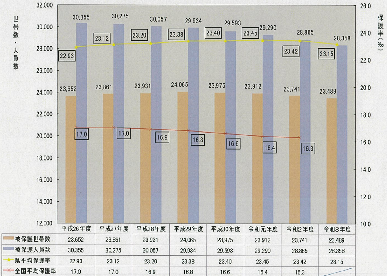
被保護世帯数・人員数・保護率(H26～R3年度 県平均)

被保護世帯全体に占める高齢者世帯の割合は年々上昇し、令和3年度は63.8%となっている。高齢者世帯以外の母子世帯、傷病・障害者世帯及びその他世帯については、世帯数、構成割合いずれも減少傾向となっている。