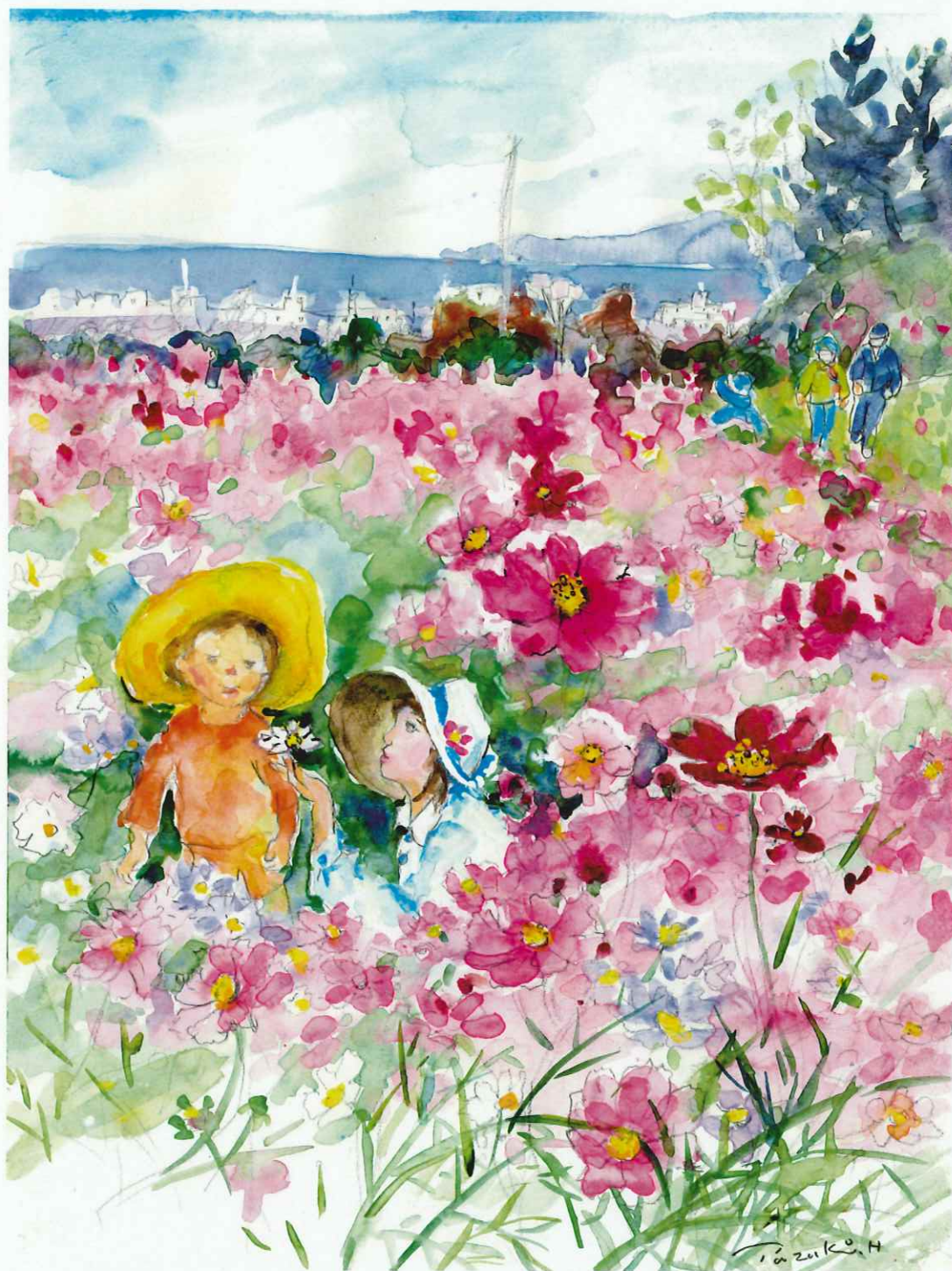
秋招味(文) 張山田鶴子 画