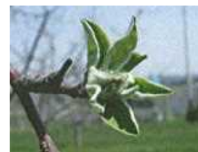
ふじの展葉1週間後頃

「ふじの展葉1週間後頃」の散布時期は、黒石、弘前、三戸で4月10～11日頃と見込まれる。地域や天候によっては散布時期が異なるので、展葉日や気象情報を参考にして適期に散布する。また、黒星病、モニリア病、リンゴハダニの防除上、最も重要な時期なので、確実に行う。