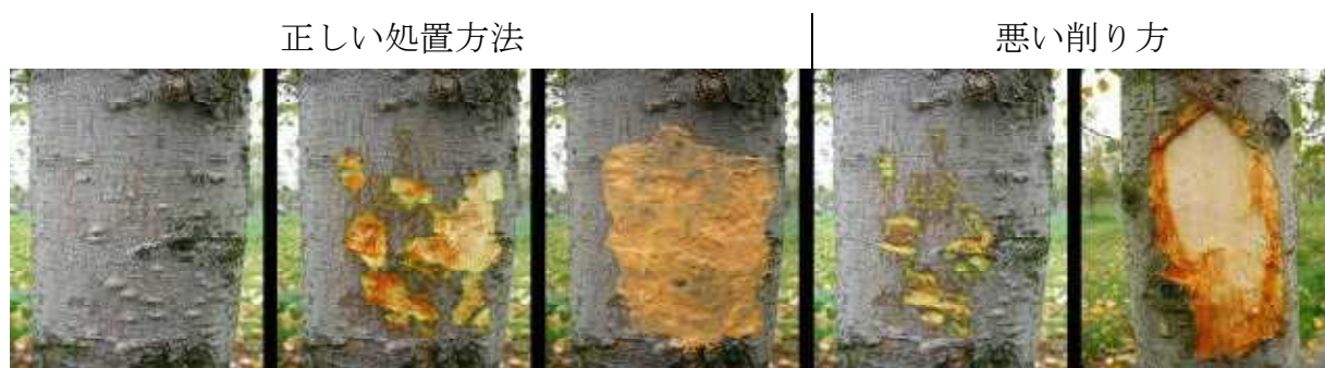
① 削り取り前 ② 削り取り完了 ③ 塗布完了後 | 削り取り不足 削り過ぎ

枝幹上のいぼ皮病斑が伝染源となるので、削り取ってトップジンMペーストを塗る。削り取りができない細い枝は、見つけ次第切り取り、適切に処分する。