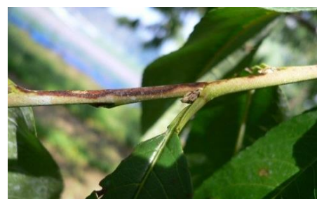
せん孔細菌病夏型枝病斑