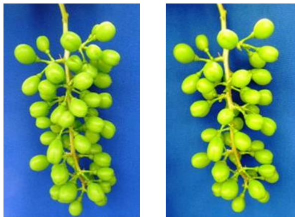
シャインマスカットの摘粒前後の果房 (左：摘粒前、右：摘粒後)

品種別の摘粒の目安は下表のとおりである。小粒果やさび果などの障害果のほか、果粒が外向きに並ぶように内側に向いた果粒を除去し、目安の果粒数にする。