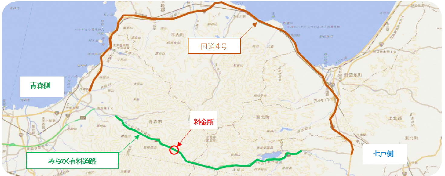
みちのく料金所平面図