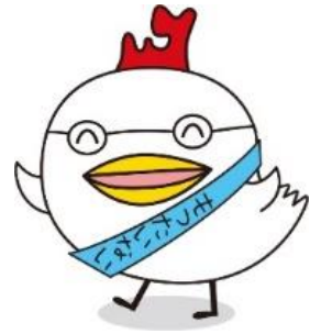
もったいない・あおもり県民運動 キャラクター「エココー」