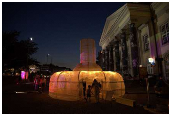
左) 栗林隆 《元気炉》2022年 《蚊帳の外》ドクメンタ15、ドイツ・カッセル)より 右) 栗林隆 《元気炉》2022年 《蚊帳の外》ドクメンタ15、ドイツ・カッセル)より