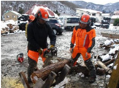
チェーンソーツアー