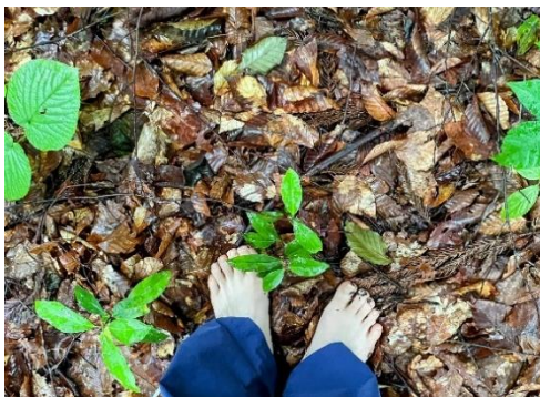
はだしトレッキング