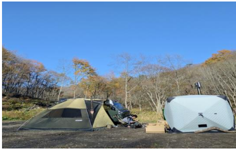
山丸ごとレンタル