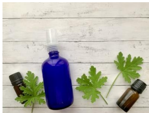
森の恵みクラフト