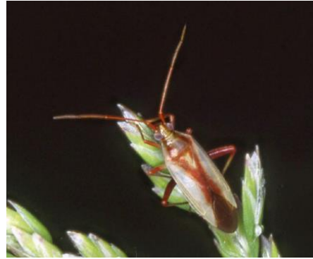
アカスジカスミカメ

————— 農薬を使用する際は必ず最新の農薬登録情報を確認してください —————