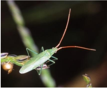
アカヒゲホソミドリカスミカメ