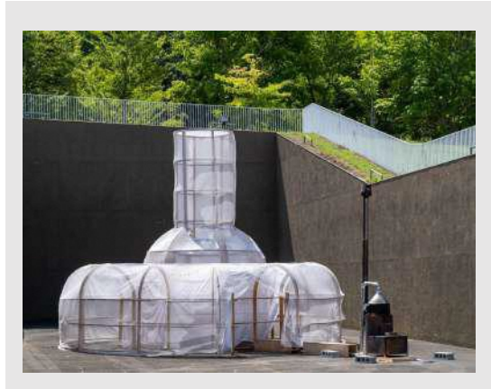
栗林隆 《元気炉》 青森県立美術館 展示の様子