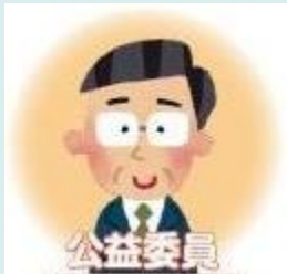
(弁護士、大学教授等)

解雇や賃金など職場のトラブルでお悩みの方は、労働委員会の委員が労使双方の主張を聴いて調整し、 解決案の提示等を行って解決する「あっせん制度」 をご利用ください。