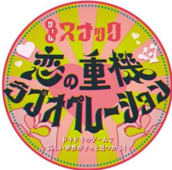
<コースターデザイン（裏）>