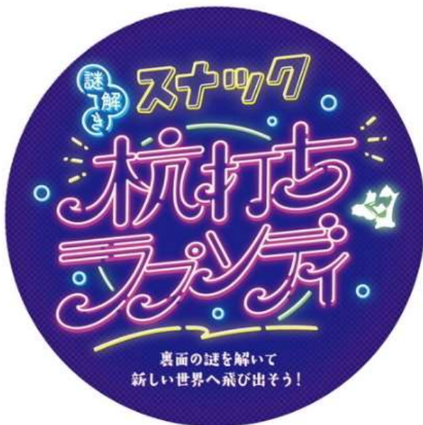
<コースターデザイン（裏）>