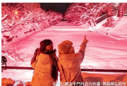
弘前公園追手門付近の外濠：青森県弘前市

本州最北端・青森県と 津軽海峡を越えた北海道道南エリア 2つのエリアの冬が織りなす 美しい世界を旅してみませんか？