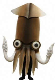
北海道函館市 観光キャラクター 「イカール星人」 ©山猫山