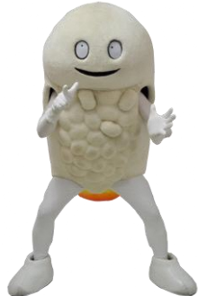
北海道北斗市 公式キャラクター 「ずーしーほっきー」