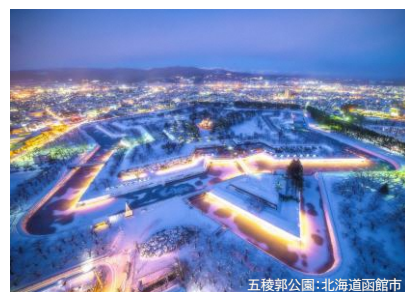
五稜郭公園：北海道函館市