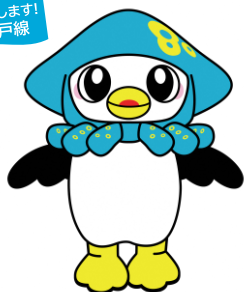
青森県八戸市 マスコットキャラクター 「いかずきんズ」