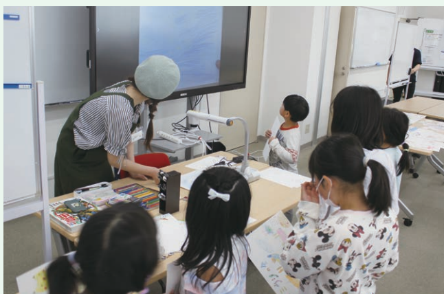
子供の居場所(てくのろくち)