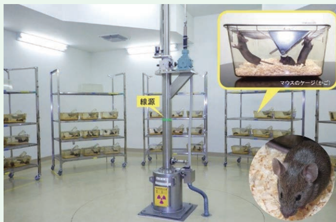
低線量率放射線連続照射室

このための低線量率放射線連続照射室は、特定の病原体がない環境下で、多数のマウスに低線量率の放射線を長期間照射できるように設計された世界でもトップクラスの施設です。