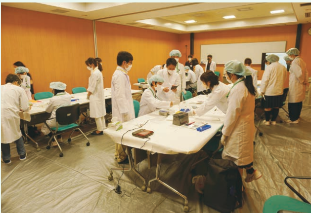
高校生サイエンスツアー(PCR実習)

子どもたちに科学に興味を持ってもらえるよう、小・中学生を対象にした理科教室や高校生サイエンスツアー等を実施しています。また、大学や教育機関等での放射線教育を支援するため、放射線測定実習や講義等への講師派遣、施設見学や各種実習の受け入れなども行っています。