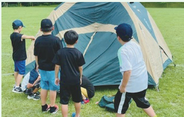
子供向け講座(サマーキャンプ)