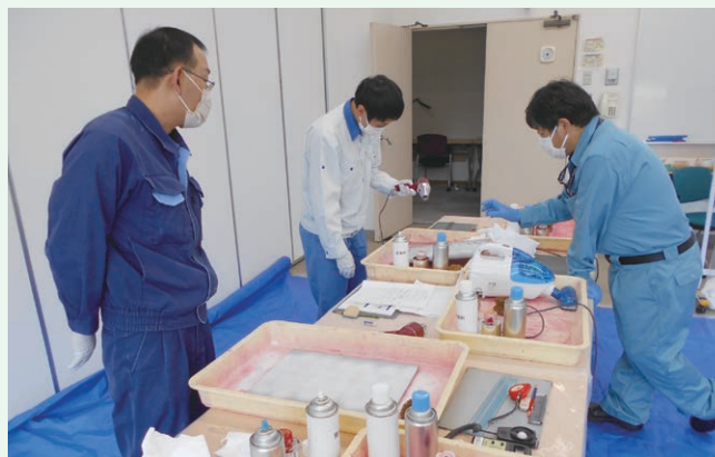
受託研修(浸透探傷試験(PT1))【実技試験対策】