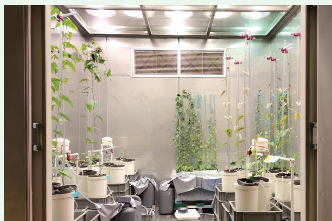
人工気象を再現して農産物の栽培実験ができる設備

本県の温度や湿度、日照など様々な気象条件を再現できる「全天候型人工気象実験施設」を用いた実験を行うことで、放射性物質の環境中での動きをより正確に予測することができるようになります。