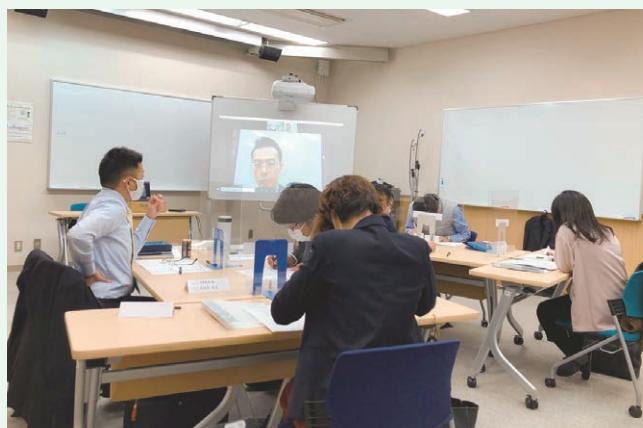
自主研修(ロジカルシンキング)