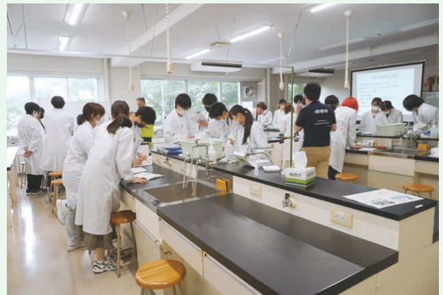
放射線実習授業(大学生向け)