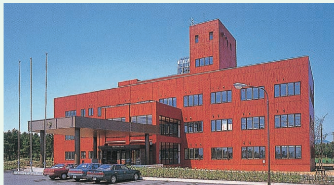
環境科学技術研究所本館

環境科学技術研究所では、以下の調査研究と理解醸成活動を行うとともに、原子力関連分野の人材育成を支援しています。