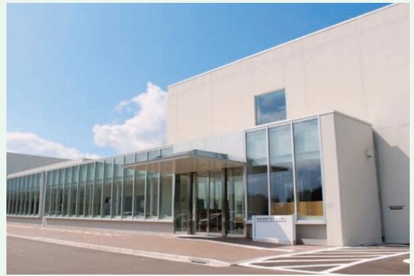
青森県量子科学センター (六ヶ所村大字尾駈字表館2-190)

センターにおいて、産業界、教育・研究機関、国、自治体等が連携協力しながら、量子科学分野における人材育成・研究開発活動を展開しています。