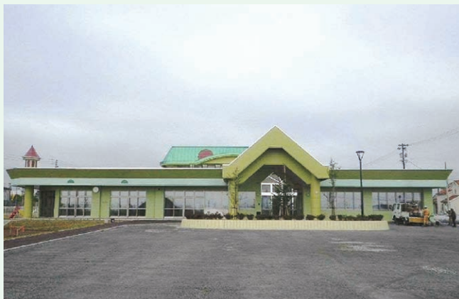
おぶちこども園運営事業(六ヶ所村)