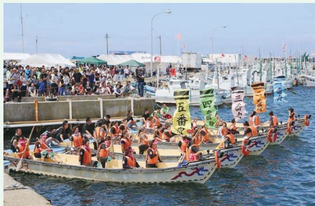
大間町ブルーマリンフェスティバル事業(大間町)