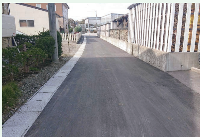
町道維持補修工事事業(おいらせ町)