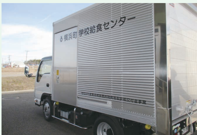
学校給食センター運搬車整備事業(横浜町)