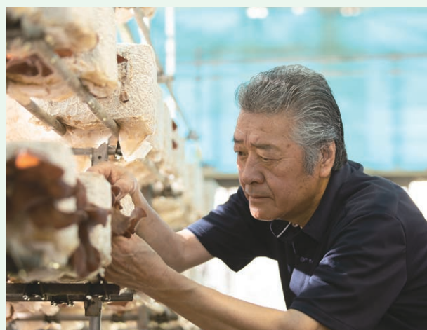
青森きくらげ認知度向上・普及拡大対策事業(全県)