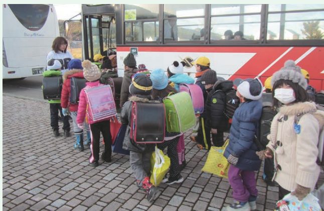
東通小・中学校及び高等学校通学バス運行委託事業(東通村)