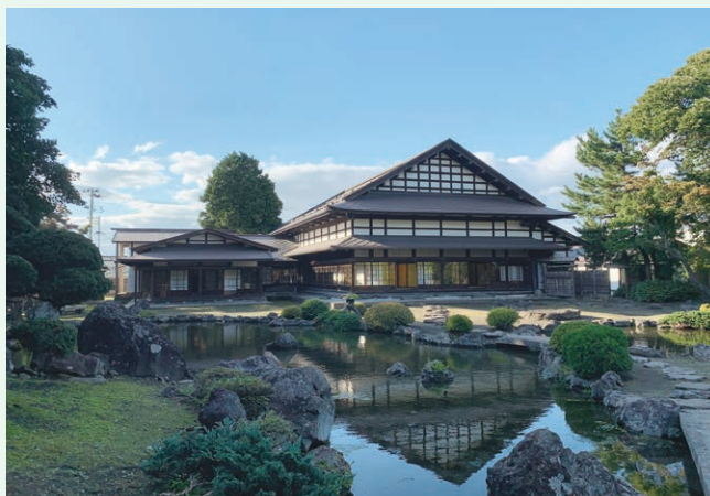
かねひらなりえん さわなりえん 名勝金平成園(澤成園)保存活用事業(黒石市)