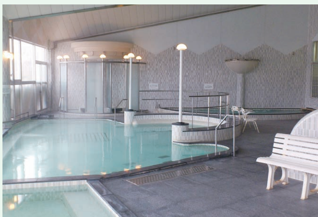
平内町温泉施設管理事業(平内町)