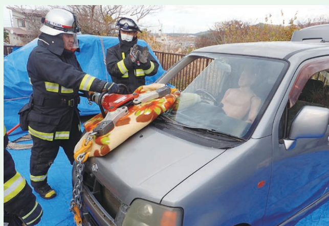
消防活動提供事業(佐井村)