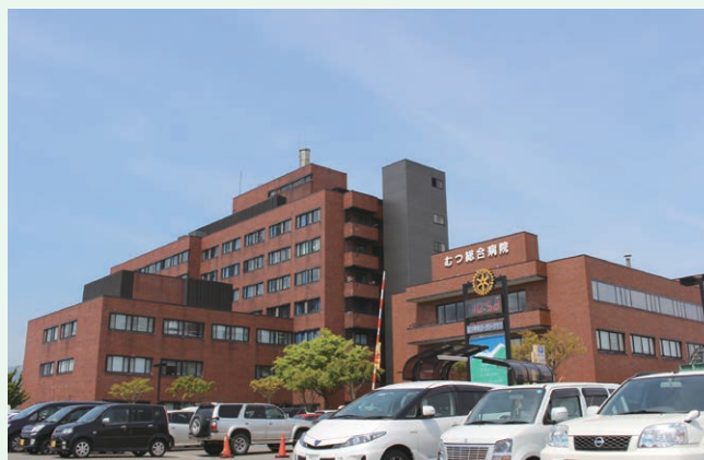
むつ総合病院運営事業(下北医療センター)