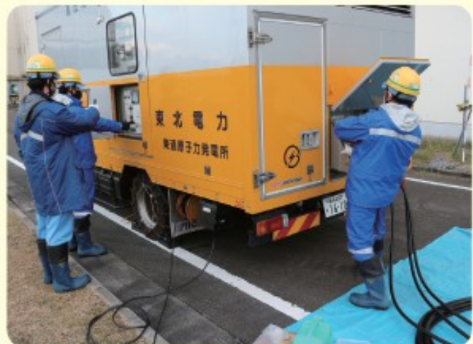
停電したときに電気を送ることができる車を動かす訓練をしている様子

原子力発電はたくさんの電気を べんり つくることができ便利だけど、事故が起きたときのえいきようはとても大きいな。