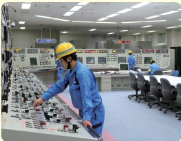
シミュレータ(訓練そうち)で訓練している様子

この事故を受けて、東通村にある東通原子力発電所や六ヶ所村につくられている再処理工場をふくめた全国の原子力施設で、よりいっそうの安全のための備えをとることとしています。