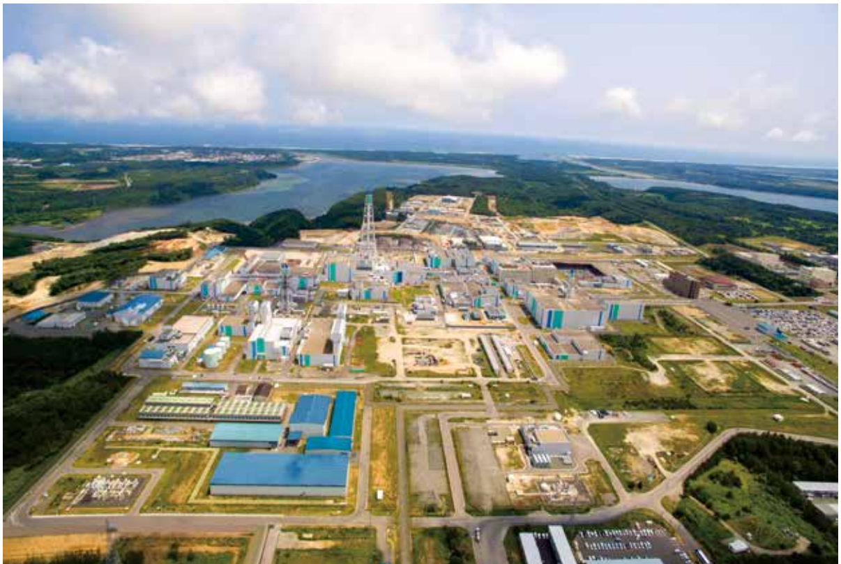
原子燃料サイクル施設（再処理工場）