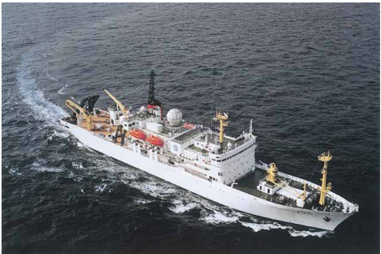
海洋地球研究船「みらい」