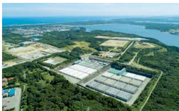
低レベル放射性廃棄物埋設センター