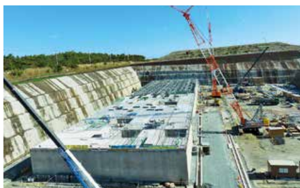
3号廃棄物埋設施設 (建設中写真)