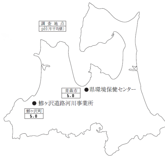
図1 令和4年度酸性雨調査結果(年平均値)

令和4年度の調査結果は図1のとおりであり、酸性雨(pH5.6以下の雨)が観測されています。なお、この測定値は、環境省が公表した「越境大気汚染・酸性雨長期モニタリング報告書」における平成25～29年度の地点別年平均値4.58～5.16(全地点平均値4.77)の範囲内の値となっています。