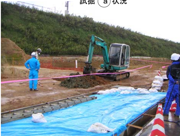
試掘 (a) 状況