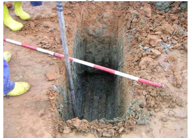
試掘 (a) 完了 (H=1.5m)