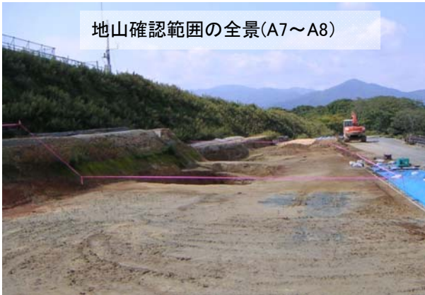
地山確認範囲の全景(A7~A8)