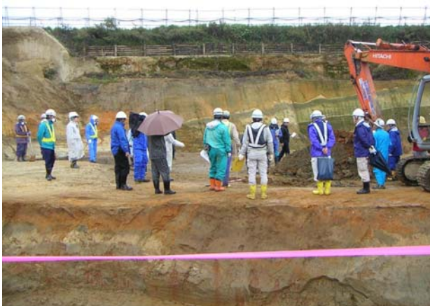
試掘 (b) 状況