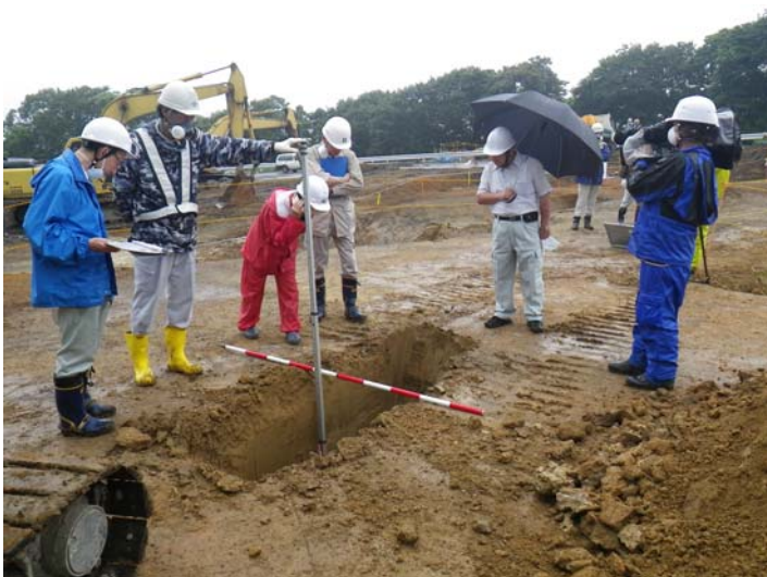
試掘箇所確認状況（中央部）