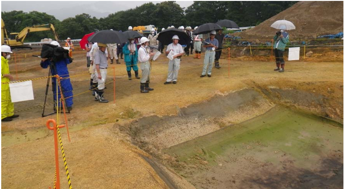
地山確認状況（中央部）