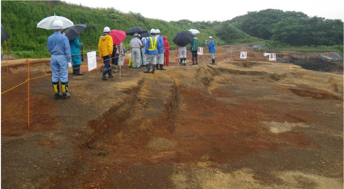
地山確認状況（西側）