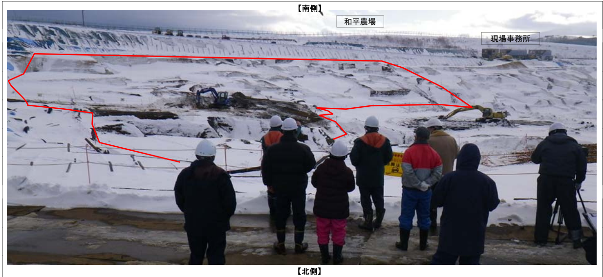
【全景(事前撮影)】（選別ヤード側〔北側〕から和平農場方向〔南側〕を望む）