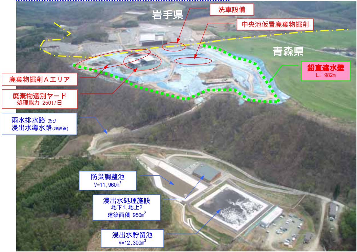
平成 17 年 4 月 県境不法投棄現場の状況写真