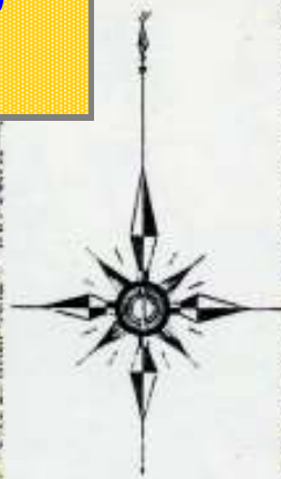
黒石温泉郷県立自然公園区域図

確認してみましょう。 住まいや事業所の場所、工事現場が 公園区域に入っていないか？