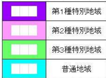
津軽国定公園区域図 (車力付近)

確認してみましょう。 住まいや事業所の場所、工事現場が 公園区域に入っていないか？