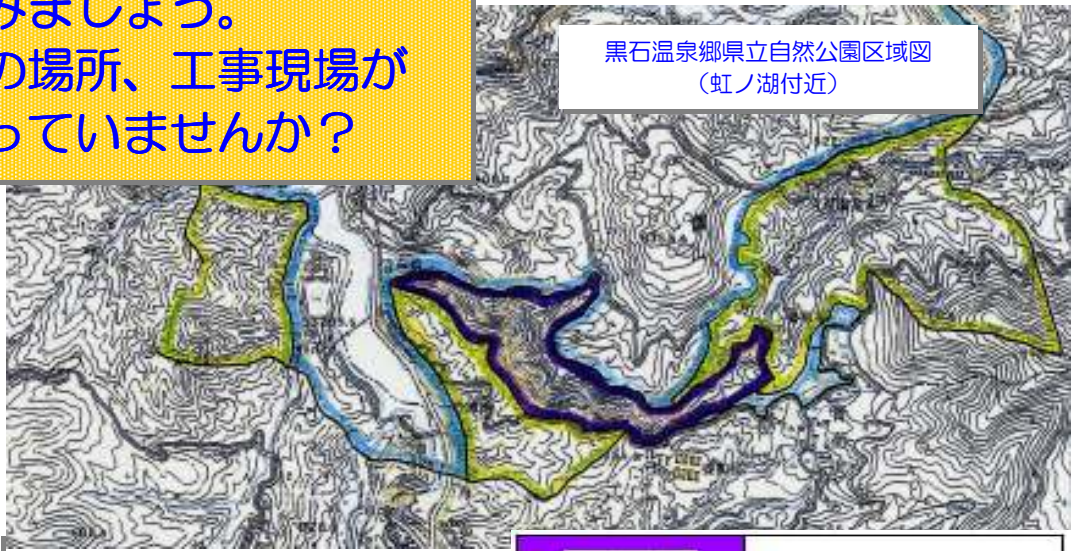
黒石温泉郷県立自然公園区域図 (虹ノ湖付近)