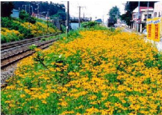
オオハンゴンソウ. A f (根市益三)