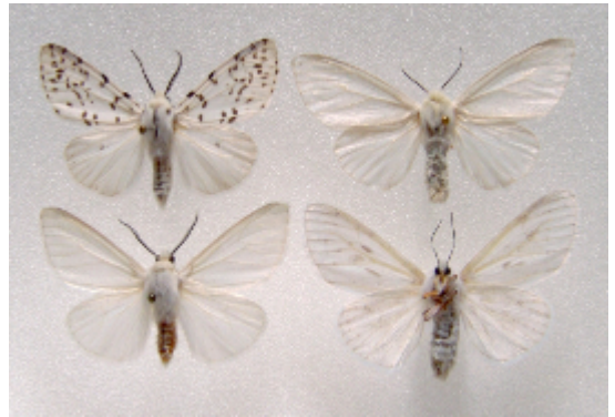
アメリカシロヒトリ. A f (室谷洋司)