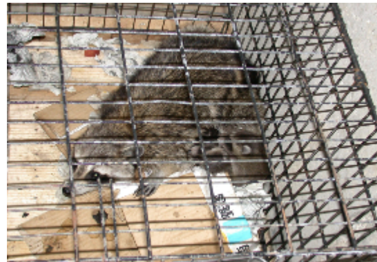
アライグマ. C f (向山 満)