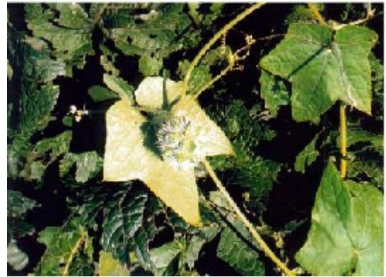
アレチウリ. A f (木村 啓)