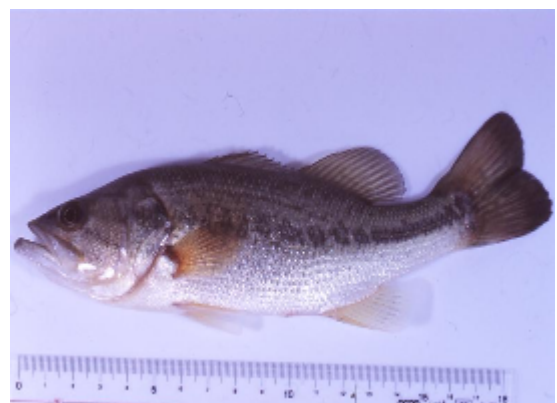
オオクチバス. A f (佐原雄二)