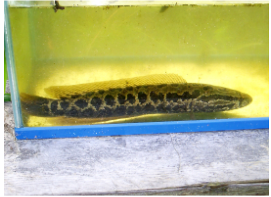
カムルチー. A f (佐原雄二)