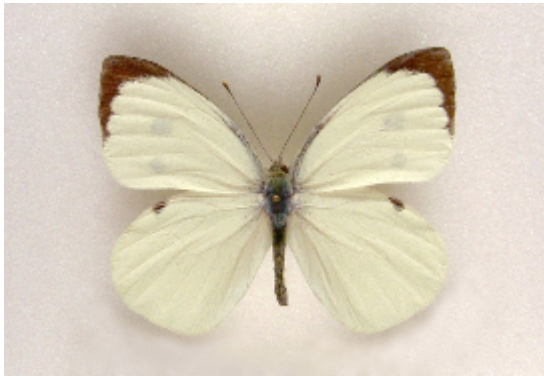
オオモンシロチョウ. A f (室谷洋司)