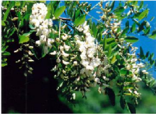
ニセアカシア (ハリヅユ). A f (木村 啓)