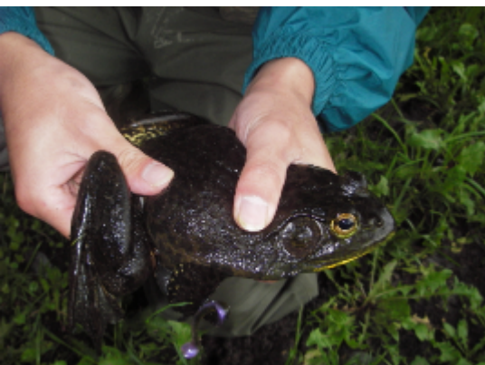
ウシガエル. A f (佐原雄二)