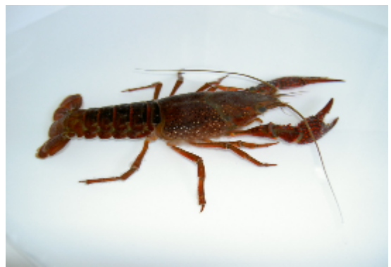
アメリカザリガニ. A f (大高明史)