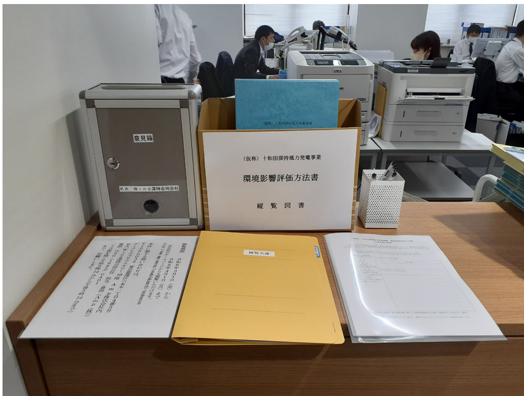
縦覧状況（十和田市役所）