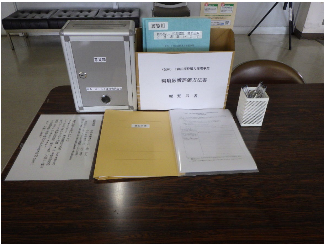
縦覧状況（七戸町役場 七戸庁舎）