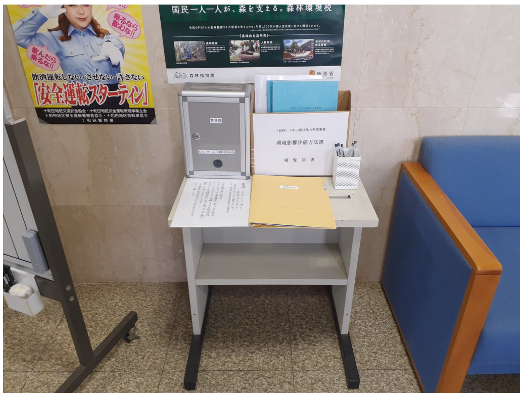
縦覧状況（十和田市西コミュニティセンター）