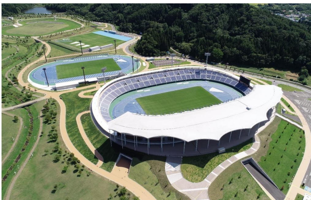
<陸上競技場の全景>