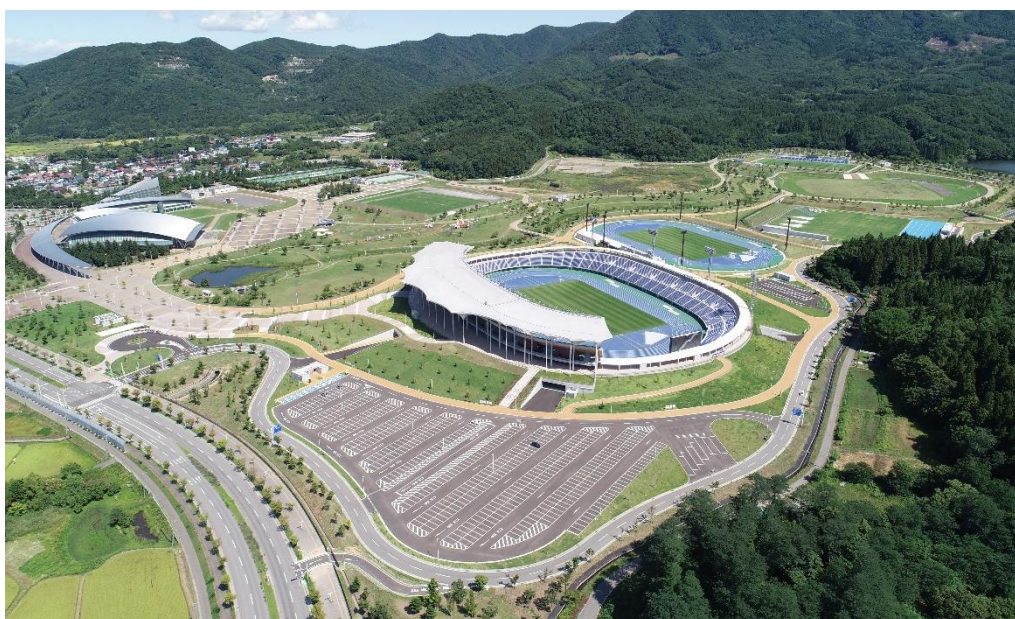
<新青森県総合運動公園の全景>

このうち、陸上競技場は2万席を超える観客席を有し、(公財)日本陸上競技連盟第1種公認及びIAAF認証クラス2の競技場として国民スポーツ大会の施設規定を満たすと共に、Jリーグ(J3)やラグビーリーグワンなどプロスポーツの開催が可能な施設です。