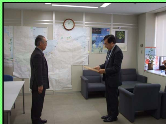
青森県ふるさとの水辺サポーター 認定授与式