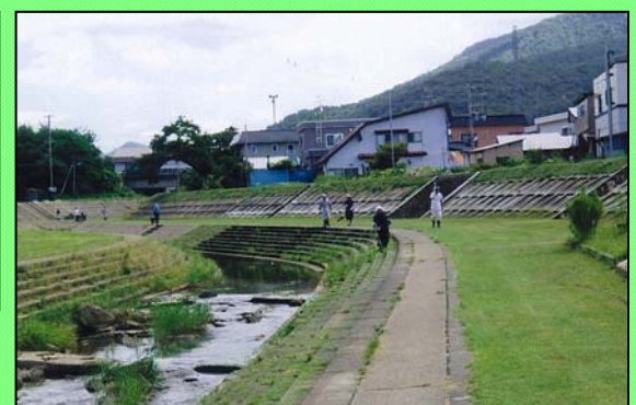
きれいになった河川敷