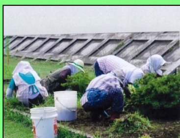
手作業による除草