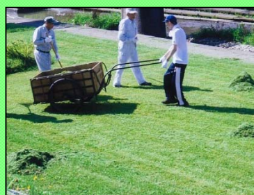
リヤカーで集草作業