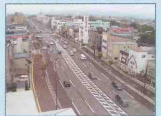
映像例:2. 国道4号堤橋