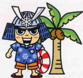
青森みち情報イメージキャラクター 「冬将くん」