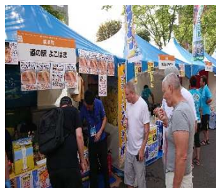
▲函館グルメ サーカス