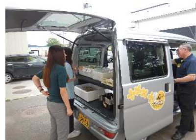
▲サービス専用車両