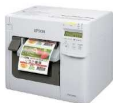
▲ラベルプリンター