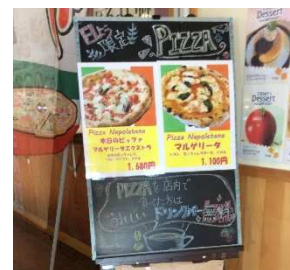
▲日曜日限定で ピザを提供