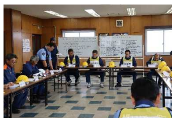
▲役場職員・消防署・消防団の初動訓練

9月22日に役場庁舎で初動訓練、本町地区（町役場）で町民参加型訓練を実施しました。