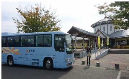
◀道の駅で買い物を終えて乗り込む利用者の様子