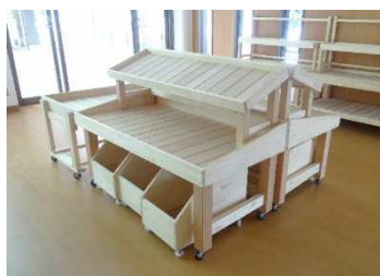
▲新しい野菜販売台