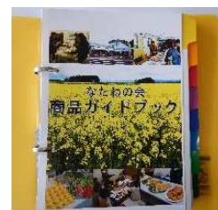
▲商品ガイドブック

（裏面には、引き続き「協議会の内容」と「第8回協議会での委員意見」を掲載しています）