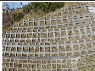
UAVを活用した点検実施