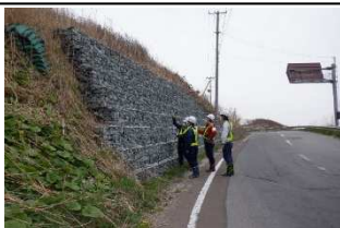
UAVを活用した点検実施