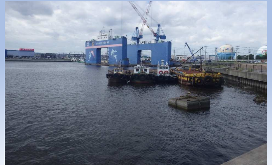
漂着物撤去後写真 令和4年8月25日