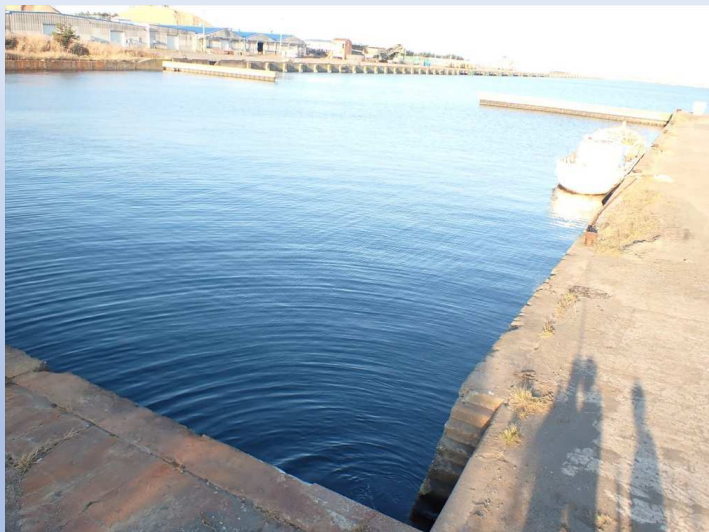
被災前写真 令和4年7月27日