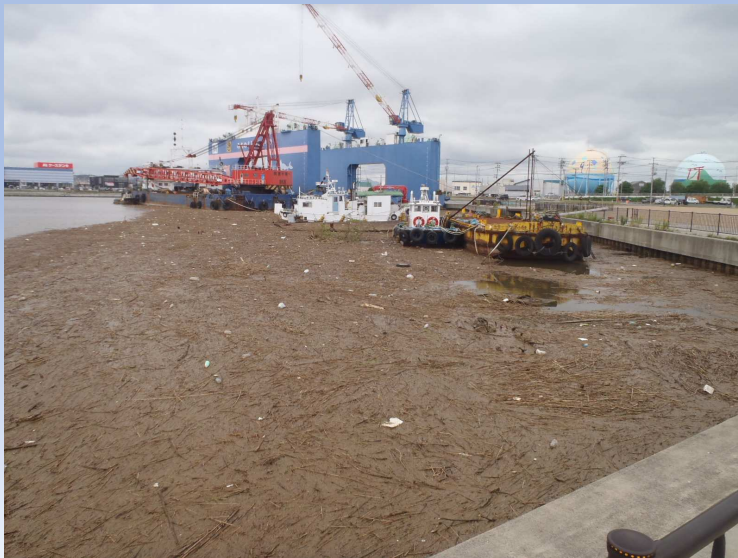
被災後写真 令和4年8月5日