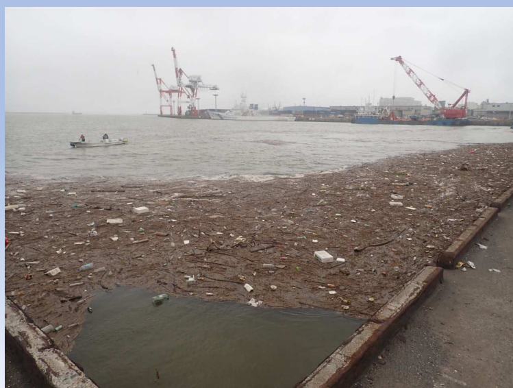
被災後写真 令和4年8月5日