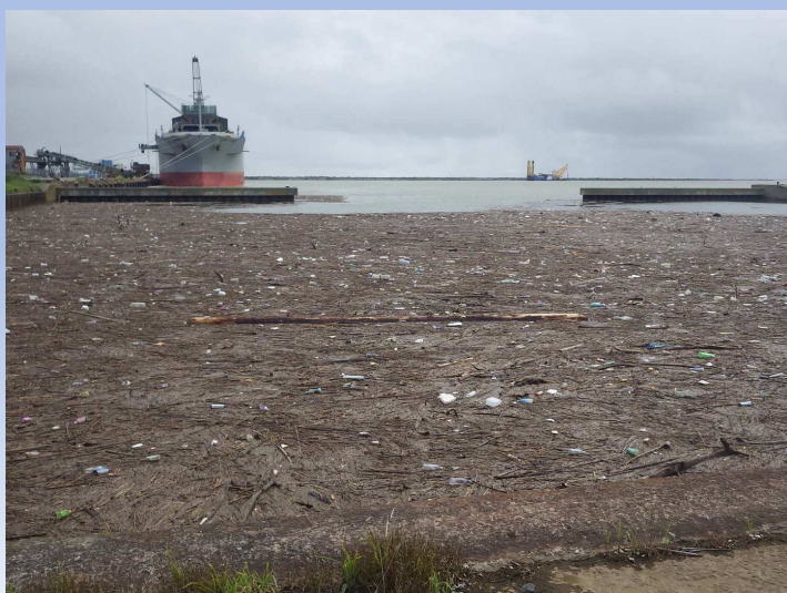
被災後写真 令和4年8月5日