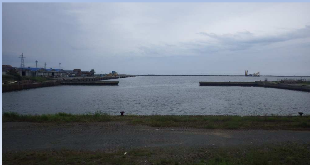
漂着物撤去後写真 令和4年8月30日