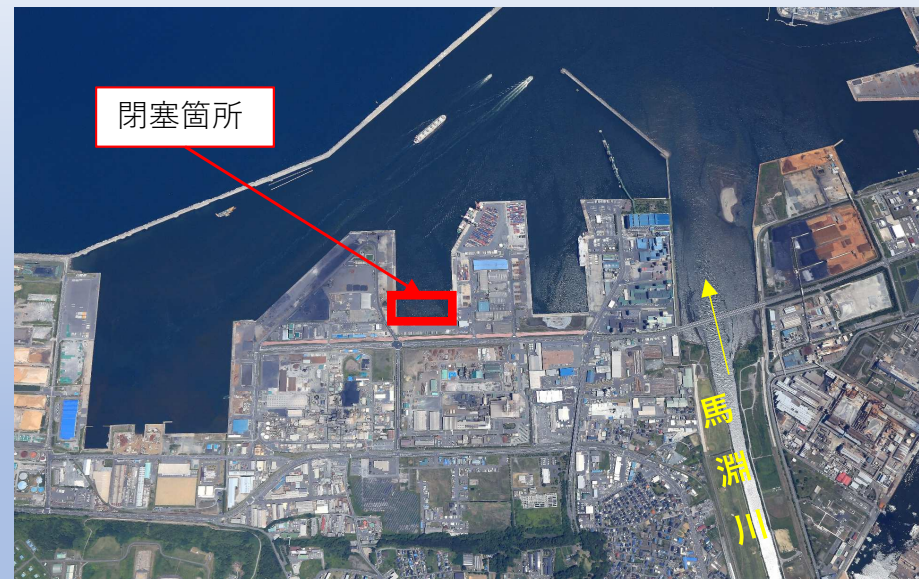
航空写真 令和3年11月17日