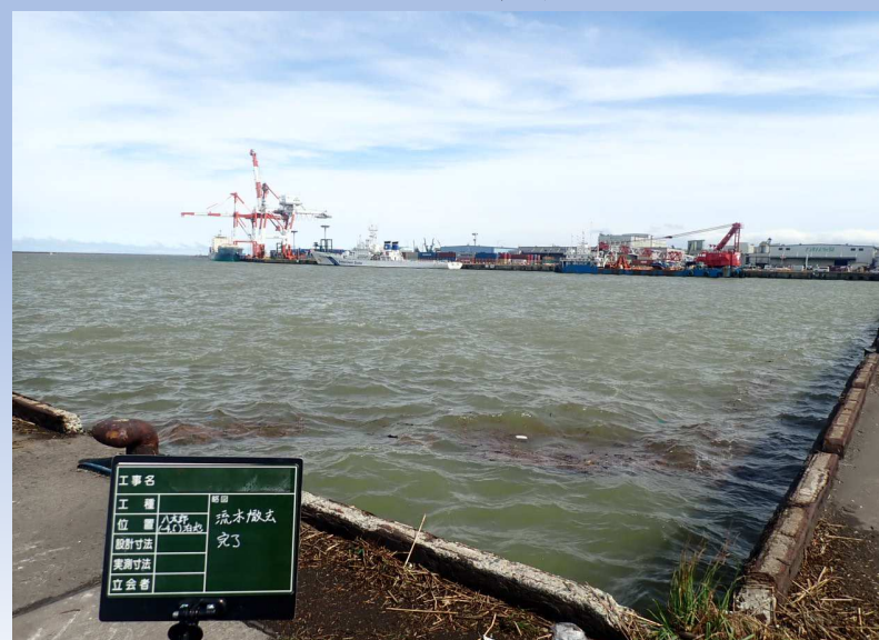
漂着物撤去後写真 令和4年8月25日