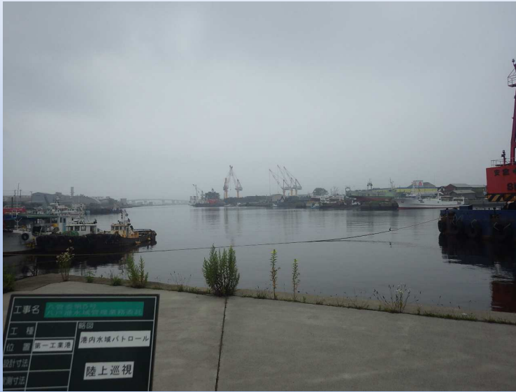
被災前写真 令和4年7月27日