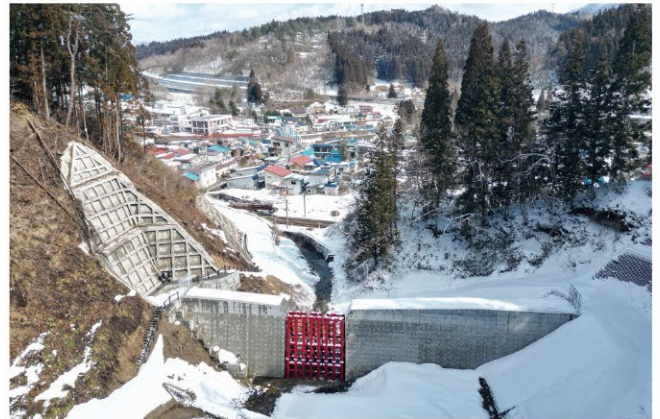
白沢事業間連携砂防等事業

令和6年度の砂防事業実施箇所は12箇所を予定しており、事業実施に当たっては防災対策と合わせて、周辺景観や地域整備に調和した豊かな水辺づくりを実施するなど、環境の保全を図りながら進めることとしています。