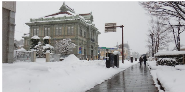
無電柱化事業 + 凍雪害防止事業 (弘前岳参ヶ沢線・弘前市下白銀町工区：令和4年3月完成)

また、橋が老朽化してから架け替えをするのではなく、定期点検を行い、計画的に補修することで長寿命化を図る橋梁アセットマネジメント事業を実施し、橋梁の適切な維持管理・保全に努めています。