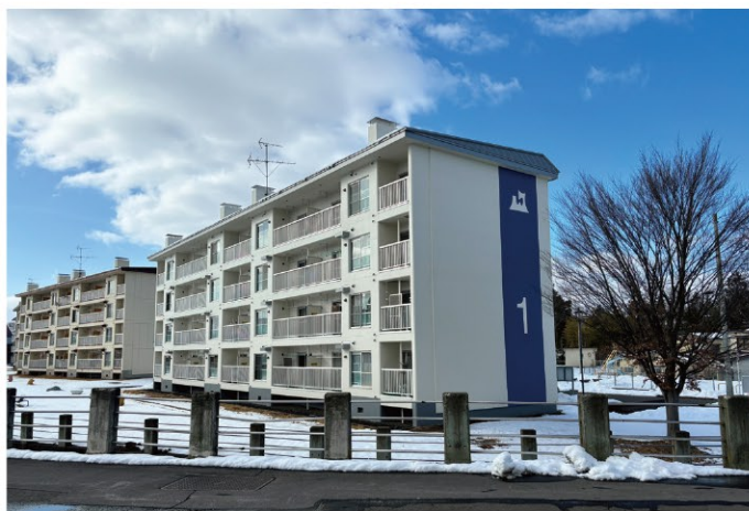
県営住宅 茂森団地

また公営住宅法に基づく県営住宅を管内に9団地（約1,200戸）整備しており、計画的に維持修繕工事を行っています。