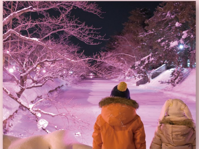
弘前市「冬に咲くさくらライトアップ」