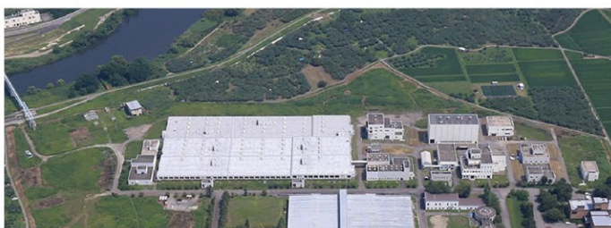
岩木川浄化センター

令和6年度は、岩木川浄化センター及び各中継ポンプ場の設備更新工事・修繕工事の他、令和8年度からの運営開始を目指し、下水汚泥を堆肥化する施設の建設が始まります。