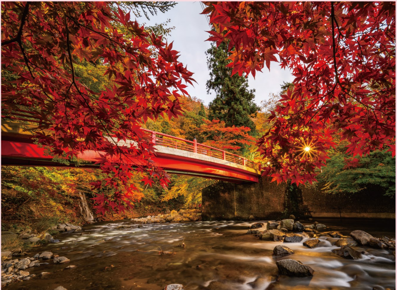
黒石市「中野もみじ山」