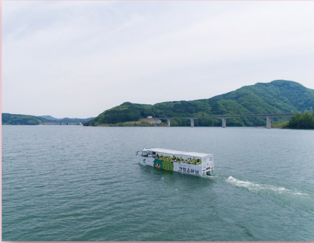
西目屋村「津軽白神湖と水陸両用バス」