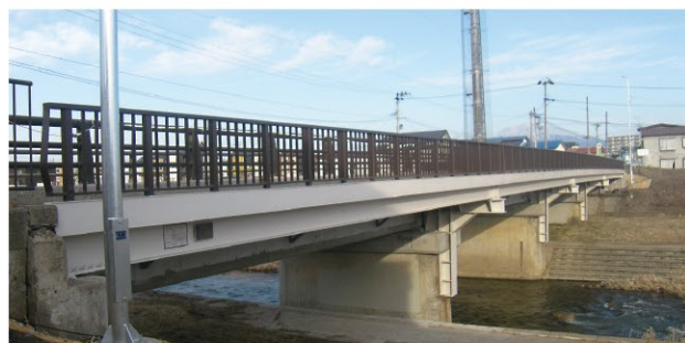
橋梁補修（長寿命化）事業 (石川土手町線・弘前市小栗山【上千年橋】：令和5年3月完成)