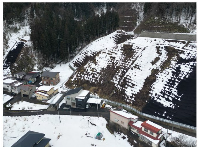
虹貝新田区域急傾斜地崩壊対策事業