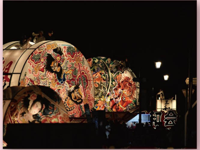
平川市「平川ねぷた」