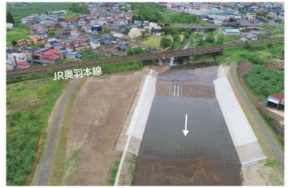
平川広域河川改修事業（大和沢川工区）

令和6年度は引き続き、大和沢川、引座川及び腰巻川について、平川広域河川改修事業を進める予定です。