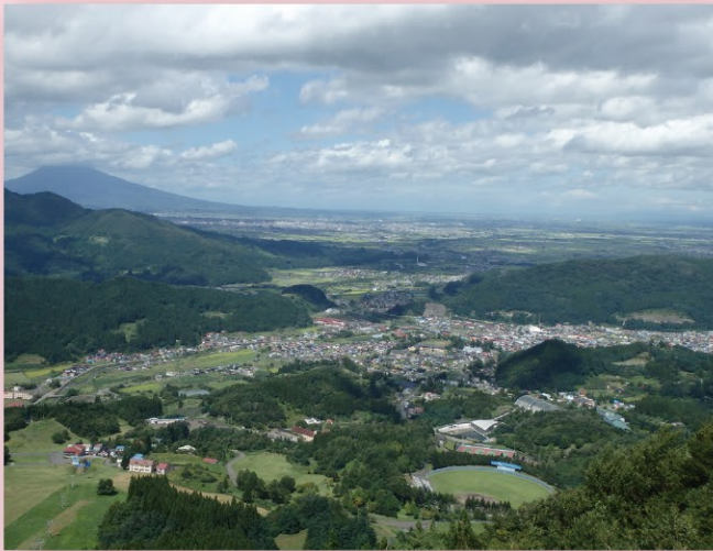
大鰐町「阿闍羅山より望む」