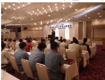
令和元年度の土砂災害防止講演会開催状況

また、川の防災と土砂災害に対する知識の習得及び防災意識の向上を図る目的で、小学生を対象とした「川の防災安全教室」を平成26年度より開催しています。昨年度は弘前市大和沢小学校で開催し、土砂災害の種類や発生メカニズム、それらに対する具体的な対策を模型や映像を用いて分かり易く説明し、「自分たちが住む地域ではどこが危険か」等、地域の実状を具体的に知ってもらう取組を進めています。（今年度はむつ市脇野沢小学校で開催予定でしたが、新型コロナウイルスの影響により中止しました。）