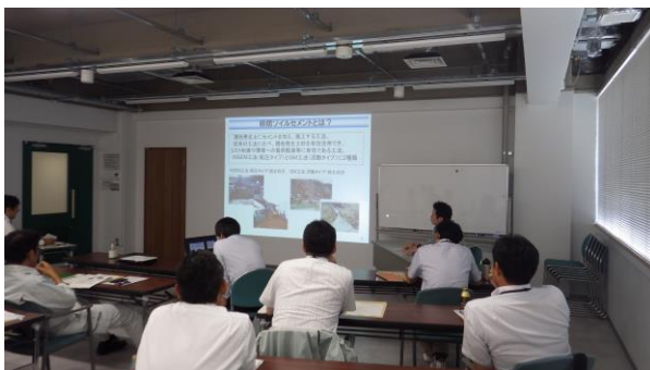
砂防情報交換会開催状況（7月開催）

令和元年度の砂防情報交換会は、7月・11月の計2回開催し、砂防施設の設計に関する基 本事項の確認、砂防事業の事例発表、現地での砂防関係施設の点検演習を行いました。