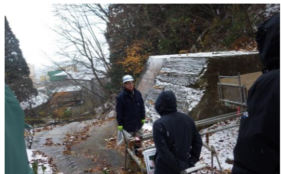
砂防関係施設の点検演習状況（11月開催）