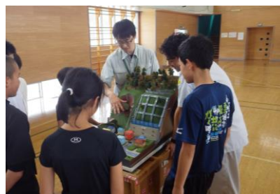
「川の防災安全教室」弘前市立大和沢小学校