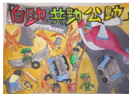
↑ 小学生絵画の部 優秀賞 （国土交通事務次官賞）