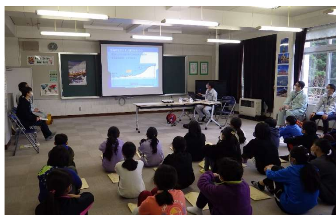
雪崩防災資料を用いた説明