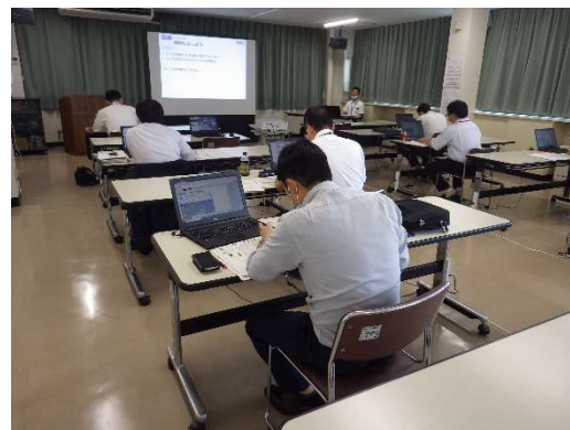
シミュレーション演習を実施中の参加者