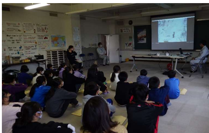
雪崩防災ビデオに集中する児童

児童代表からは「学校のまわりにこんなに雪崩危険箇所があると思わなかった。」、「雪崩という言葉は知っていたが、どんな現象が起こるのか知らなかった。防災教室で雪崩の怖さを学ぶことができた。」などの感想をいただきました。