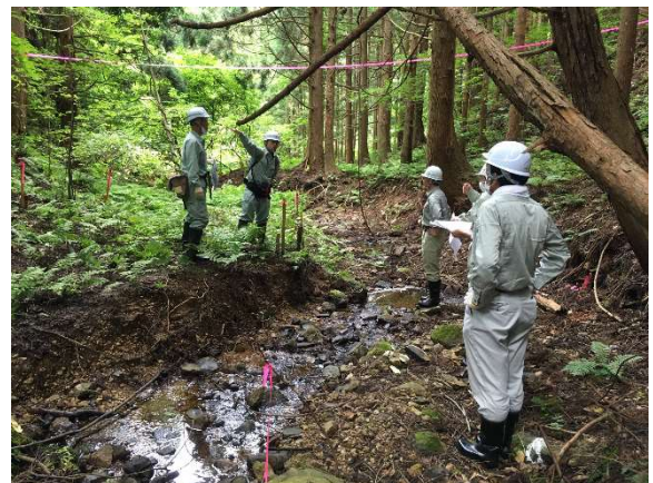
うがいさわ 嗽沢（中泊町）