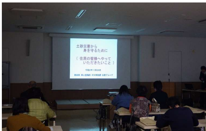
講義資料を用いた説明

講義後のアンケートでは、「大変参考になった。」などの意見を多くいただきました。今後も、住民の方々に土砂災害の危険性や避難の方法などについて理解を深めていただけるように、出前トークなどを通じた積極的な周知活動に努めていきたいと思っております。