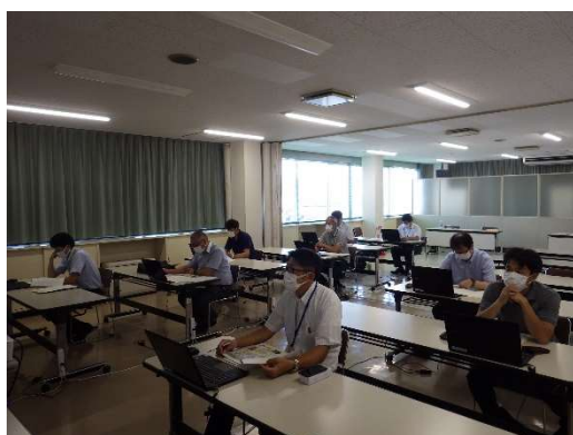
真剣な表情で受講中の参加者