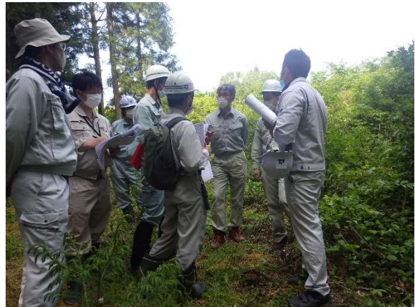
かみならさきさわ 上七崎沢（八戸市）