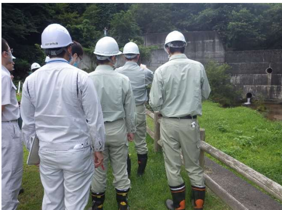
おもさわ オモ沢（十和田市）