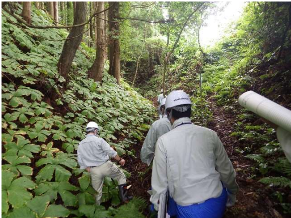
ろくじょうまさわ 六條間沢（外ヶ浜町）

今後についても、適宜、技術指導をいただきながら堰堤の施設機能の向上を図るとともに、職員等の砂防に対する技術力の向上に努めていきたいと思っております。