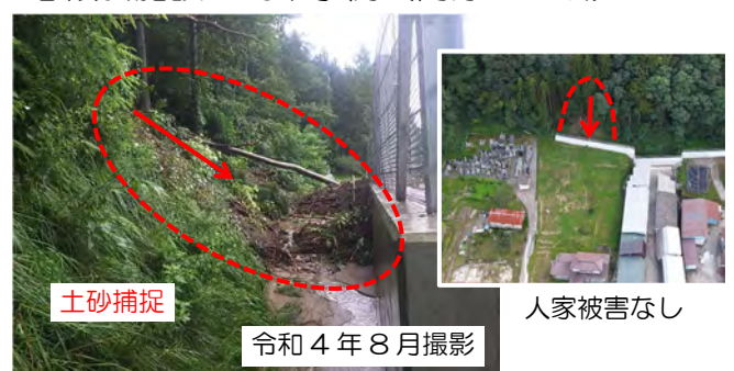
擁壁が土砂を捕捉し、人家への被害を防止