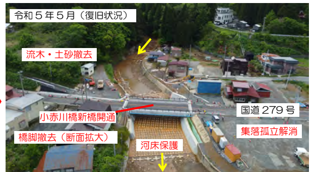
新橋が完成し開通済