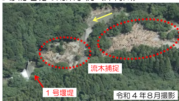
堰堤が土石流を捕捉し、下流被害を防止