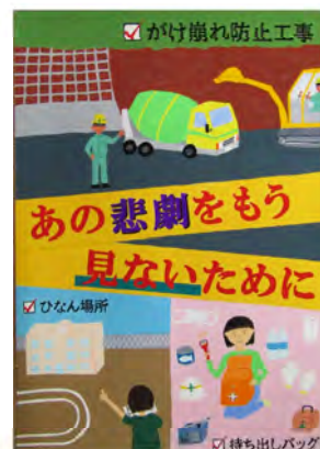
↑中学生絵画の部 青森県最優秀賞