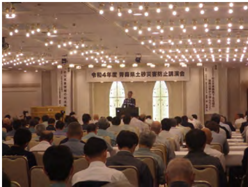
令和4年度の土砂災害防止講演会開催状況

また、川の防災と土砂災害に対する「知識の習得」及び「防災意識の向上」を図る目的で、小学生を対象とした「川の防災安全教室」を平成26年度より開催しています。土砂災害の種類や発生メカニズムなどについて、映像や模型を用いて分かりやすく説明し、「自分たちが住む地域ではどこが危険か」等、地域の実状を具体的に知ってもらう取組を進めています。今年度は外ヶ浜町立三厩小学校で開催予定です。