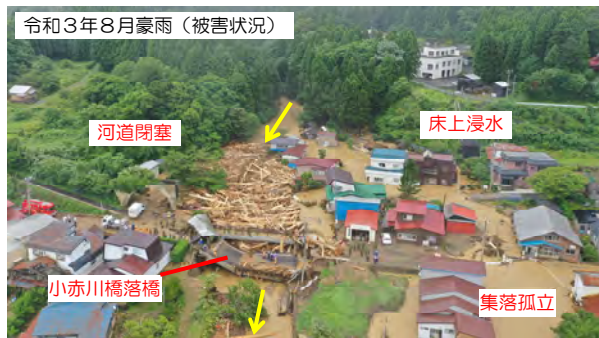
土石流により落橋が発生