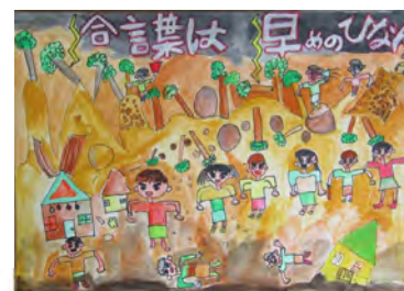
↑小学生絵画の部 青森県最優秀賞