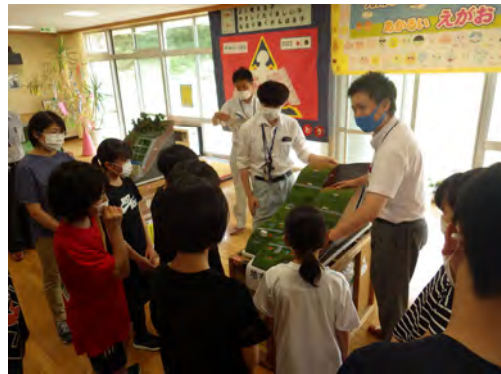
「令和4年度川の防災安全教室」 深浦町立いわさき小学校