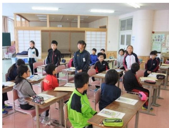
感想を発表する児童たち