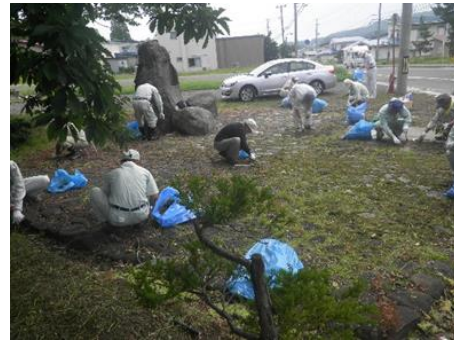
②蔵助沢（弘前市）では、砂防施設周辺の清掃や草刈り・施設の安全点検（7月）