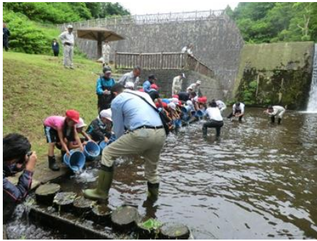
①滝ノ沢ふるさと愛ランド（中泊町）では、「子供達と共に夢を創る会」と合同で小学生によるヤマメの稚魚放流（6月）