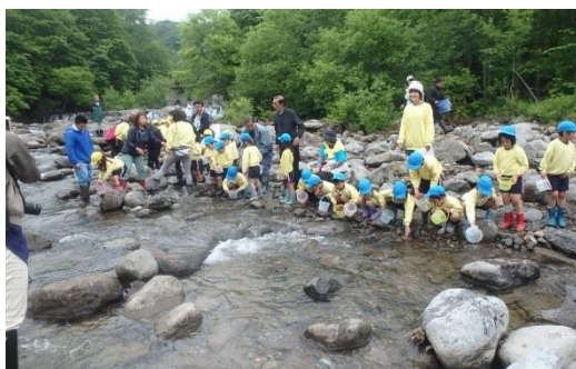
園児によるイワナの放流