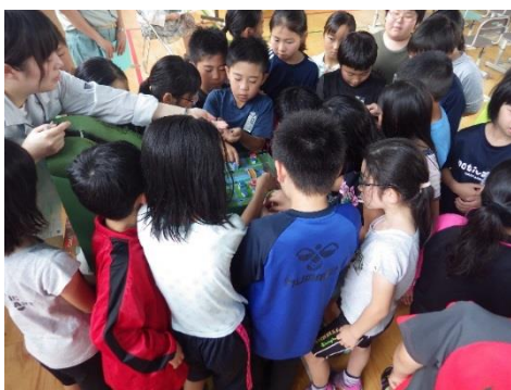
砂防模型を楽しむ児童たち

今年度は7月5日（水）に南部町立名久井小学校で開催し、砂防模型と土石流・火砕流の二オイのサンプルを使用し、砂防施設と土砂災害について楽しみながら理解を深めていました。