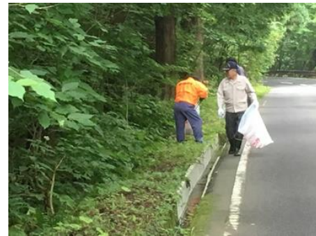
④鳶川（十和田市）では、「あおもりの川を愛する会」と合同で清掃活動（9月）