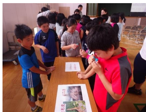
土石流・火砕流の二オイをかぐ児童たち