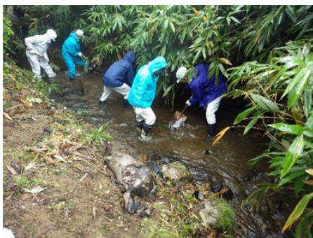
③滝ノ沢川（外ヶ浜町）では、イワナの産卵床づくりと施設の維持管理（9月）