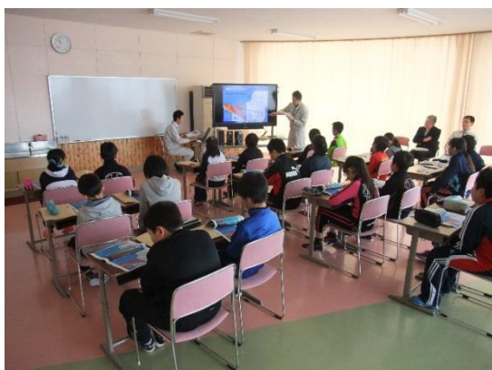
説明を熱心に聞く児童たち

児童からは「私たちが住んでいる近くにも雪崩の危険な場所がある事がわかり、気をつけようと思いました。」「雪崩の兆候を見つけたら近づかないようにしようと思いました。」「表層雪崩は新幹線と同じくらいの速さで滑り落ちることがわかりました。」との感想をいただきました。